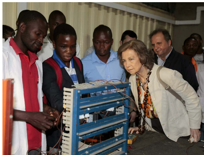
La reina doña Sofía, durante la visita a varios proyectos financiados por la Cooperación Española, en Maputo en abril de 2013.

Ha sido ministro de Agricultura a partir de 2010, hasta que fue nombrado como ministro de Asuntos Exteriores y de Cooperación en diciembre de 2017. Ha ocupado cargos de relevancia en el partido Frelimo, siendo miembro de su órgano principal, la Comisión Política desde el 9º Congreso de Frelimo (2006) hasta ahora (reelegido en el 11er Congreso en 2017).