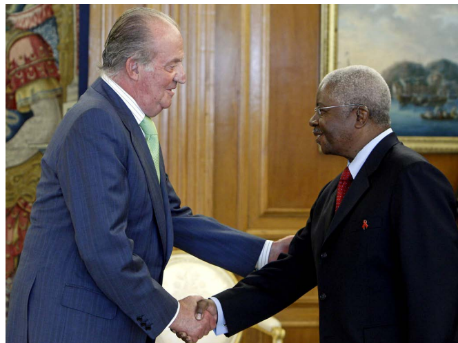
El rey Juan Carlos saluda al anterior presidente de Mozambique, Armando Guebuza, durante su visita a España en octubre de 2010.

la VII Comisión Mixta de Cooperación, junto con la viceministra de Asuntos Extranjeros y Cooperación. También realizó un desplazamiento a Cabo Delgado.